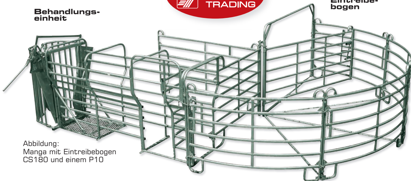
Abbildung: Manga mit Eintreibebogen CS180 und einem P10